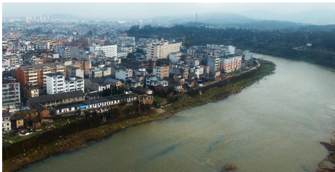
基地东北向鸟瞰图