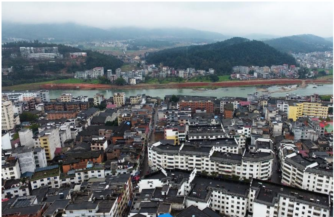
北岸城区南向基地鸟瞰图